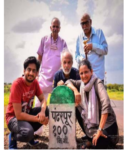
कारखानिसांची वारी मधील एक दृश्य